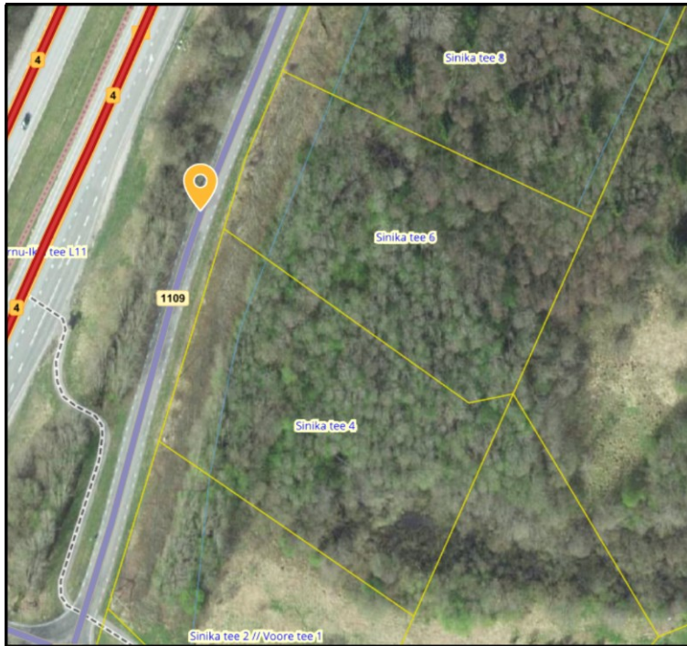
Joonis 1. Väljavõte Maa-ameti teeregistrist